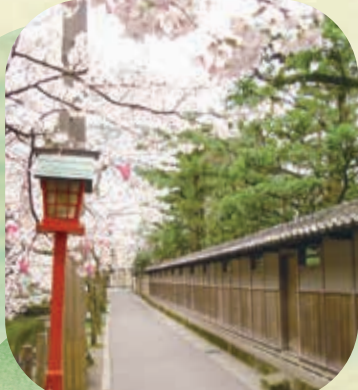
Kiyomachi Dori St. 木屋町通り

城崎温泉ロープウェイ まるで自然の中を空中散歩しているかのような爽快感を体験できます。山頂駅で一望できる城崎のまち並みと日本海の眺めは絶景。 ☎第2・4木曜日 | 9:10~17:10 | ☎0796-32-2530