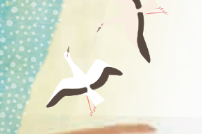
Kinosaki Bungeikan Literature Museum 城崎文芸館