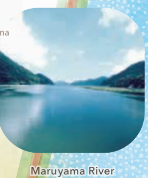
Maruyama River 円山川