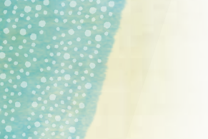
Benten Park 弁天公園