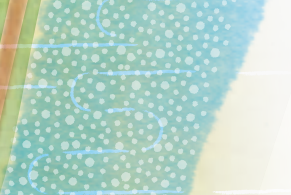
Honjuji Temple 本住寺